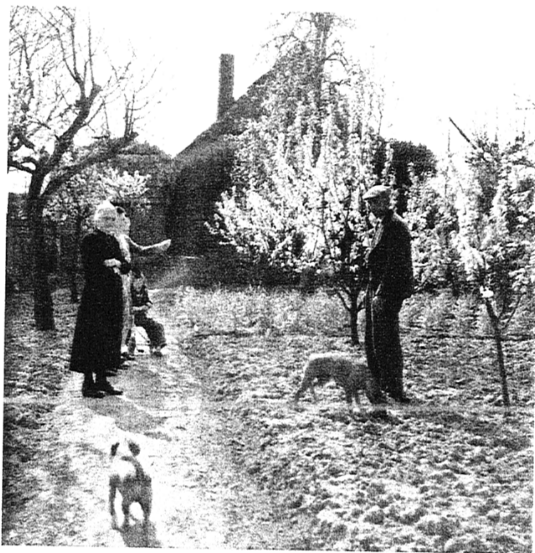
Oma en Joep Garben in hun tuin in Azewijn

klopten die morgen om 6.30 uur bij een contactadres aan.