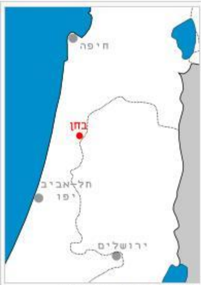
מיקום קיבוץ בחן במפת ישראל

בחן הוא קיבוץ ששמו מוזכר בישיעיהו ומשמעותו מגדל צופים. קיבוץ בחן - נוסד בשנת 1954 על ידי גרעין נח"ל ל"מרחב" יוצאי אמריקה הדרומית. אוכלוסייה: 370 נפש. ענפי המשק: חקלאות - כותנה, תירס לתעשייה, רפת, לול ופיטום, בתי צמיחה לנוי ואבוקדו. בתעשייה - מפעל "תחכום" - ייצור מבלטים ומכבשים. בתחום התיירות: "כיופון" - אירוח ולינה כפרית. היישוב הינו חלק ממועצה אזורית עמק חפר.